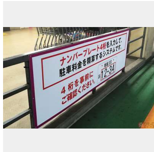
車両の出入りはナンバープレートで管理される（2019年9月）